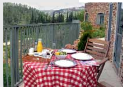
נופש באוויר הרים צלול כיון. טור סיני

הקסם של המקום טמון בשדרת התבלינים המפוארת, שם תמצאו לוואיה, לימונית ומרווה, צמחי מרפא ועשבי תיבול, ובעצי הפרי הפורחים. מי שיבקר בחוה החל מחדש מאי, יוכל ליהנות מאפרסקים, נקטריות ועוד פירות היישר מן העץ.